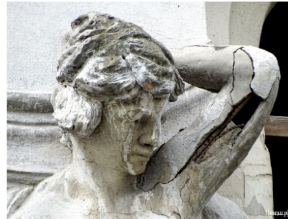
Разрушение скульптуры под действием кислотных дождей

Статуи и строения, которые веками простояли без повреждений, в последние десятилетия стали разрушаться под действием кислотных дождей.