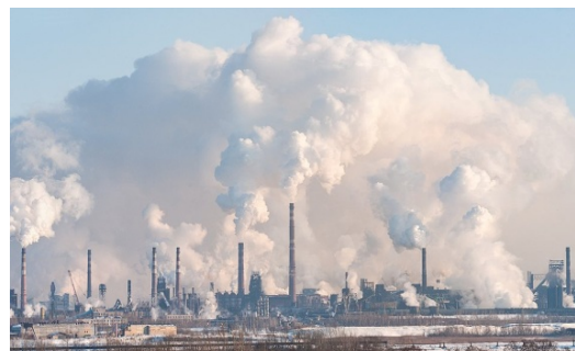
Загрязнение воздуха в г. Липецке