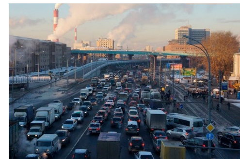
Загрязнение воздуха в Москве

Город Липецк, население которого составляет около 500000 жителей, расположен в Центральном федеральном округе. Это крупнейший в Европе центр чёрной металлургии. Город Москва – самый большой город и главный транспортный узел страны.